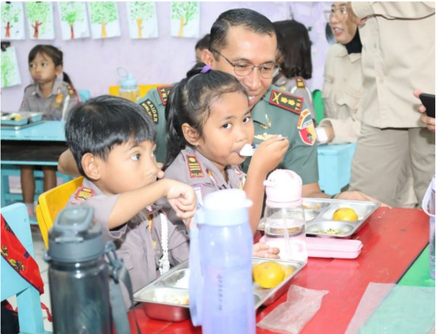
Dandim 0804/Magetan Bersama Forkopimda Dampingi Pemberian Uji Coba Makanan Bergizi Gratis