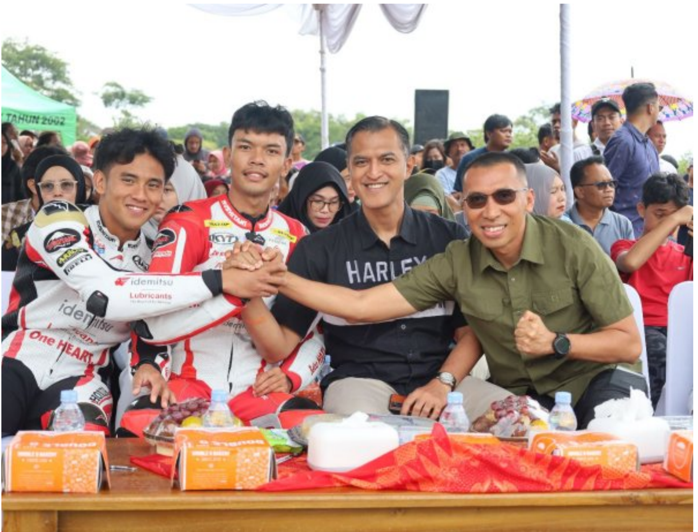
Dandim 0804/Magetan Hadiri Undangan Tinjau Sirkuit Magetan