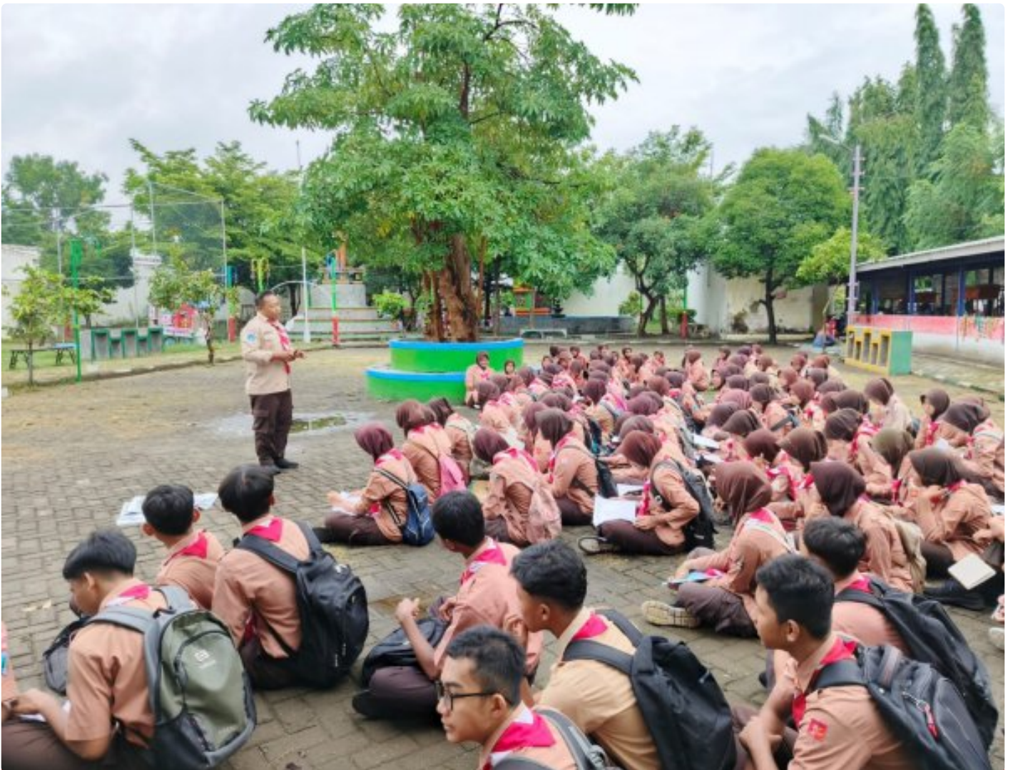
Pembinaan Pramuka Saka Wira Kartika Materi Krida Navigasi Darat Untuk Pengembangan Keterampilan

Magetan. - Dalam rangka memperkuat kemampuan dan keterampilan anggota Pramuka Saka Wira Kartika melaksanakan pembinaan dan pelatihan Krida Navigasi Darat (Navrad). Acara ini diikuti oleh 125 orang anggota pramuka dari